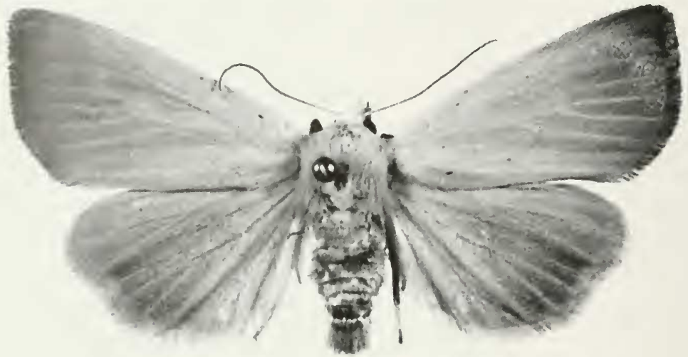
Abb. 3: Arenostola phragmitidis HBN., in Bayern vom Aussterben bedroht (Rote Liste 1).